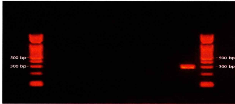
電気泳動像 (Gel electrophoresis of PCR products)

(・ KHV specific amplicon was not detected by PCR test using genomic DNA extracted from gills of samples as template.)